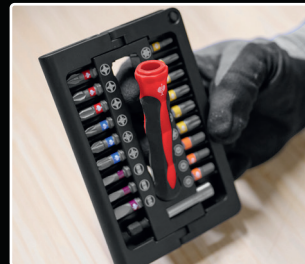
kompakt und übersichtlich