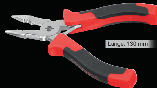
Länge: 130 mm