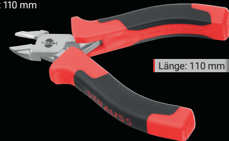
Länge: 110 mm