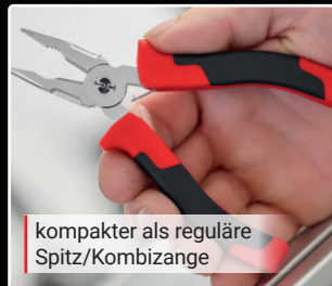
kompakter als reguläre Spitz/ Kombizange