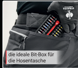
die ideale Bit-Box für die Hosentasche