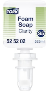
Tork Reine Hand Mini Schaumseife 525202