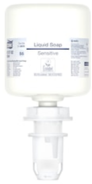
Tork Sensitive Hand Mini Flüssigseife 425702