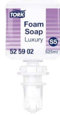
Tork Luxuriöse Hand Mini Schaumseife 525902