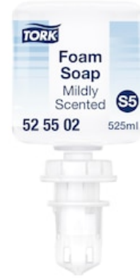
Tork Mild-Duftende Hand Mini Schaumseife 525502