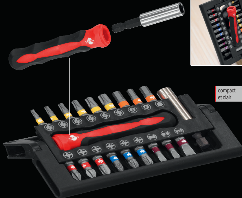
poignée pratique avec support à embouts magnétique