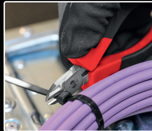
plus compacte que la pince coupante normale