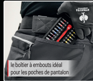
le boîtier à embouts idéal pour les poches de pantalon